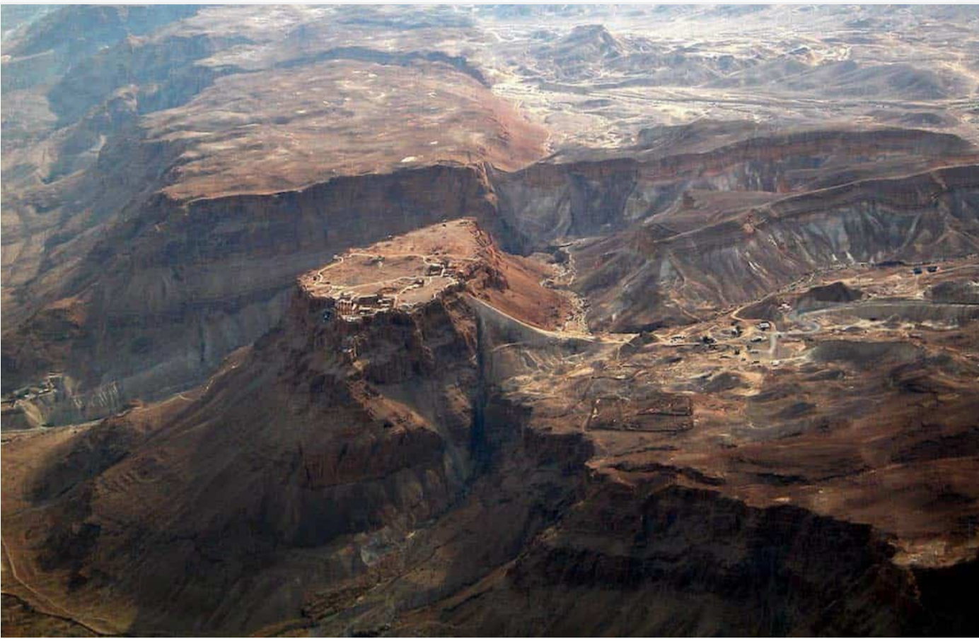
马萨大：认识主后70年以色列与罗马对抗的历史