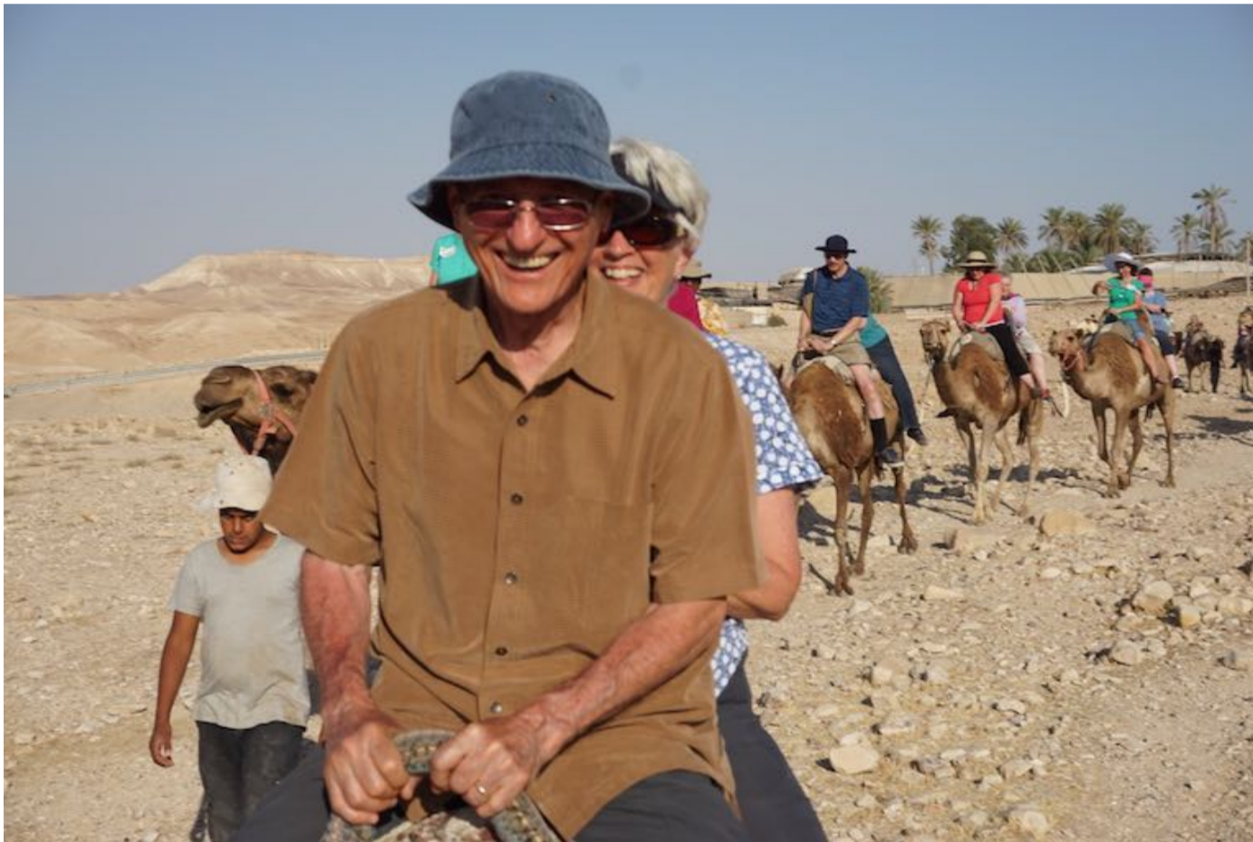
体会以色列人骑骆驼的经历

你将会进入到圣经世界，体会和学习圣经的地理历史和文化。我们除了会参观经典景点，也会去许多普遍的购物观光团不会去的圣经地点实地考察。