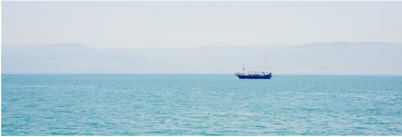
在加利利湖坐船，体会门徒与主在船上的经历