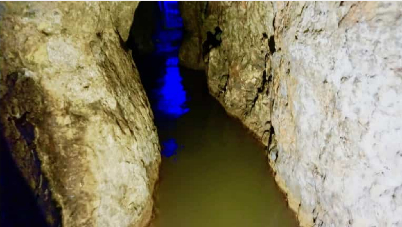
希西家隧道：了解和体会耶路撒冷的水利工程