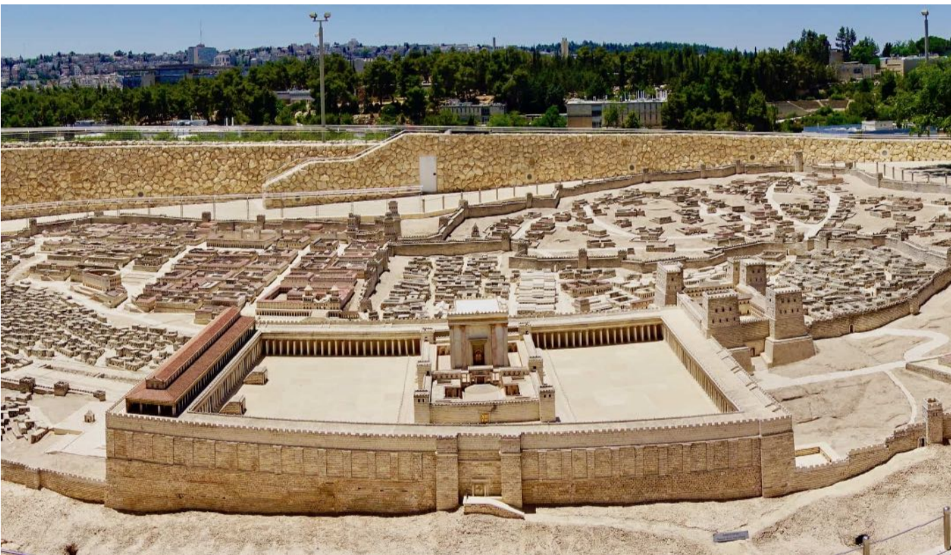
以色列博物馆：学习第二圣殿时期的耶路撒冷