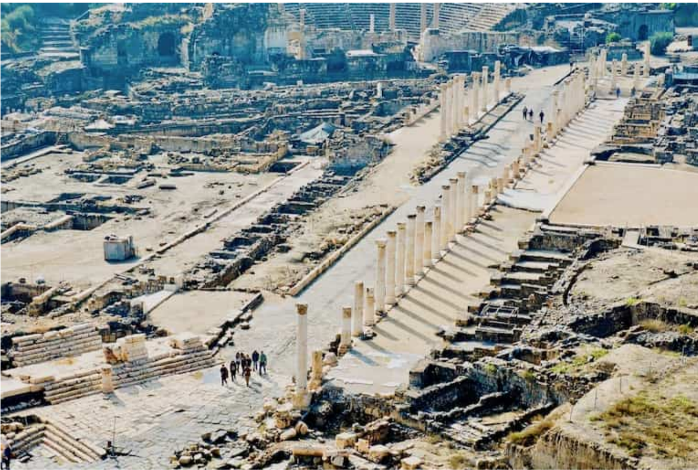
以色列最大的罗马城伯善