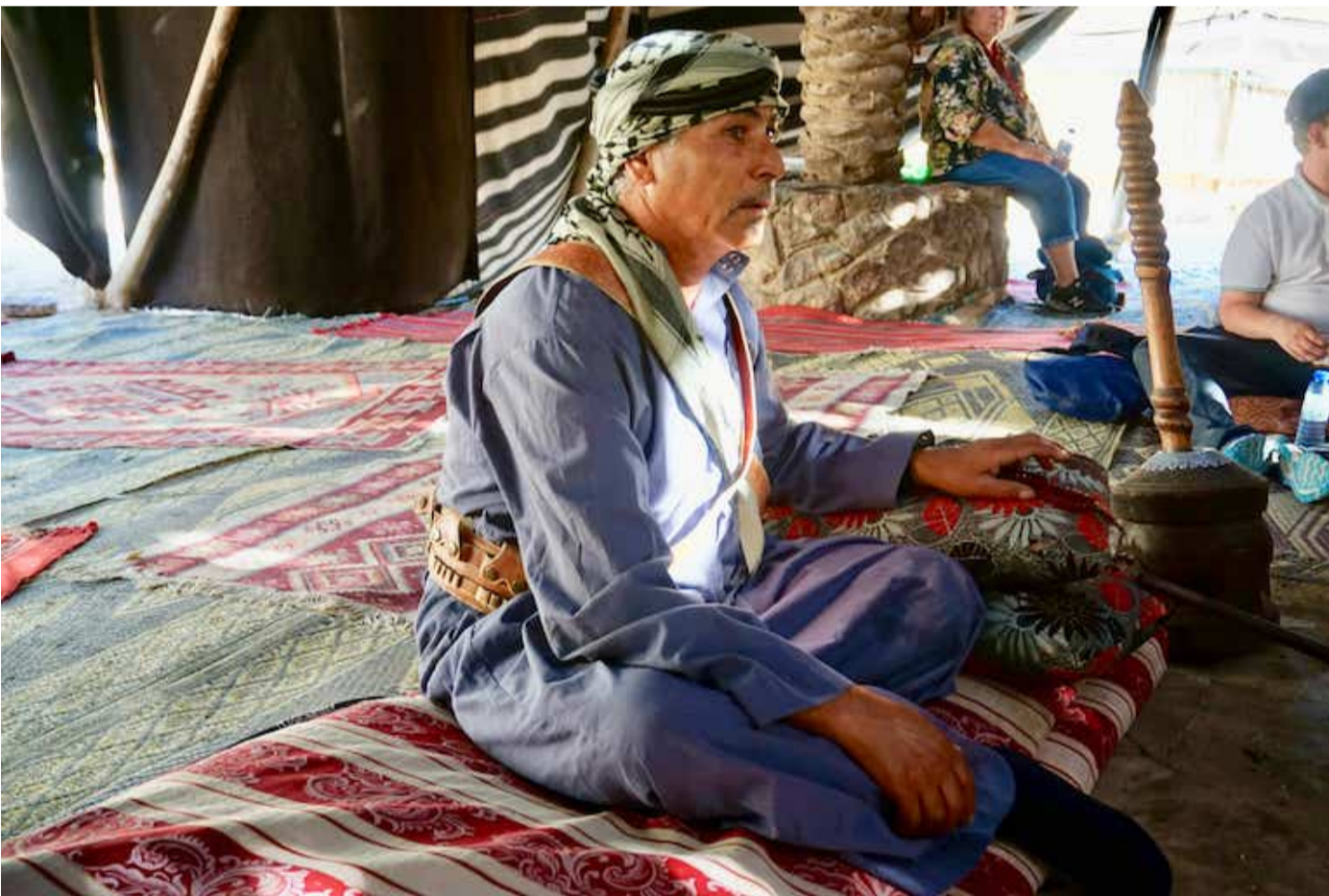
认识游牧民族贝都因人